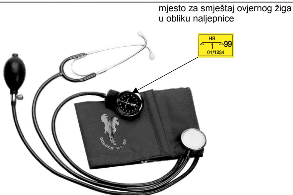
Slika 1: Fotografija tlakomjera za krvni tlak tip Agram 2000, serija 50