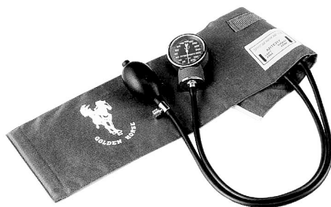
Slika 2: Fotografija tlakomjera za krvni tlak tip Agram 2000, serije 20